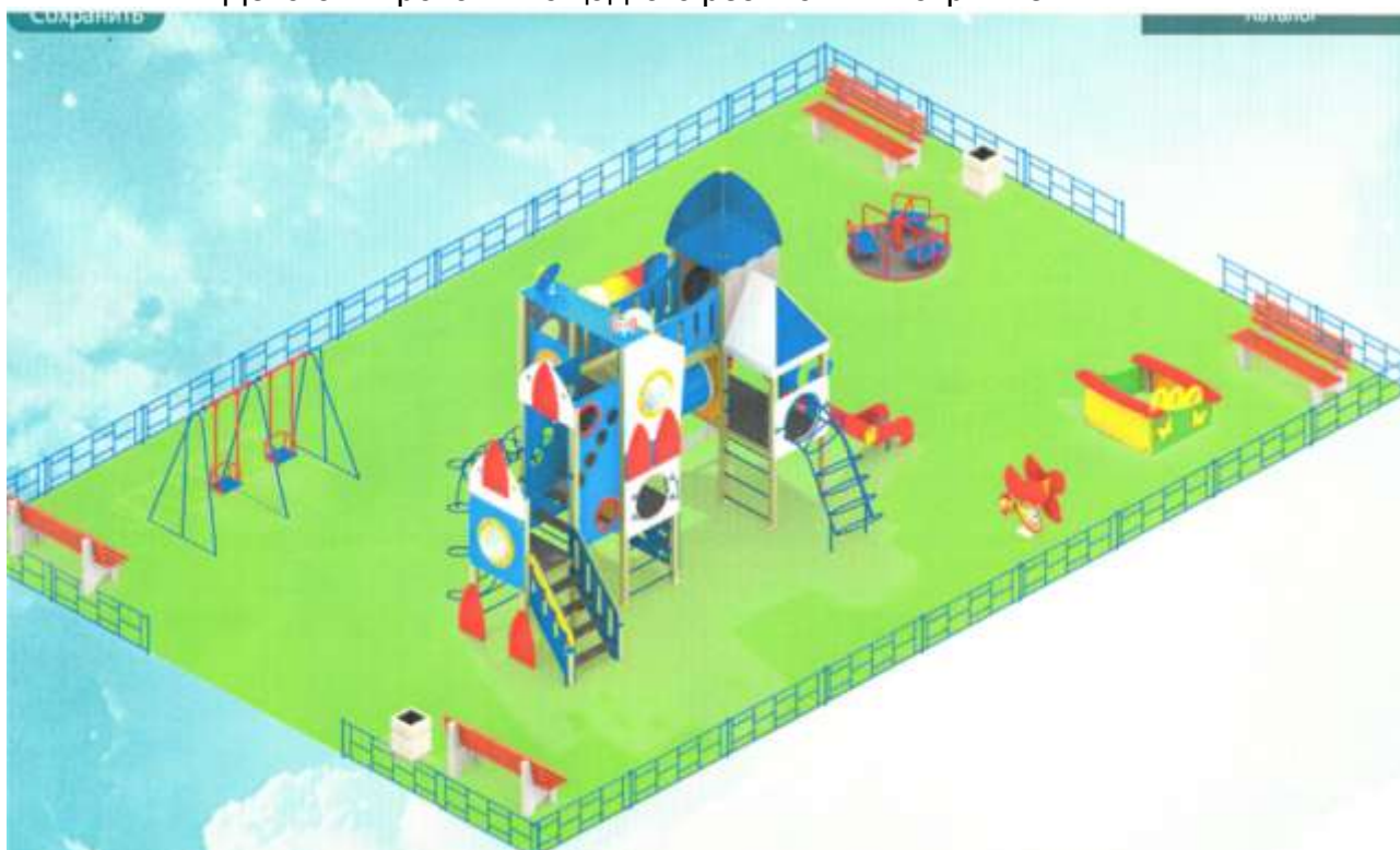
Детская игровая площадка с резиновым покрытием

Конструктивные решения элементов благоустройства дворовой территории: